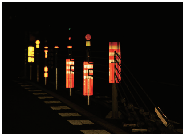
「PW-L-WR」 & 「PW-L-WR-2」 夜間反射